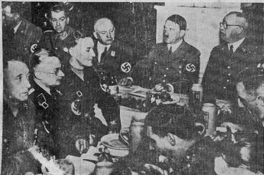
Adolfo Hitler aparece sentado con sus camaradas de su viejo partido de Munich, con ocasión de reciente entrevista. Lo acompañan el ministro de hacienda Schwartz y los líderes Adolfo Wagner y Bruckner.

LONDRES, 2. UP. — El gobierno de la Gran Bretaña se acercó oficialmente a los gobiernos de Burgos y Barcelona ofreciendo sus buenos oficios con la intención de negociar algún convenio entre los dos beligerantes para abolir los terribles bombardeos de que ha sido víctima la población civil en ambos territorios. La Gran Bretaña tiene la mayor simpatía para los deseos expresados por el gobierno francés ayer de que es imprescindible tomar alguna acción para impedir los bombardeos sin distinciones de los civiles en España. De las fuentes más autorizadas la United Press ha sido informada de que el gobierno británico ya se ha dirigido a los dos gobiernos por medio de sus respectivos representantes, haciendo sus gestiones independientemente de las que ha iniciado Francia hacia el mismo fin.